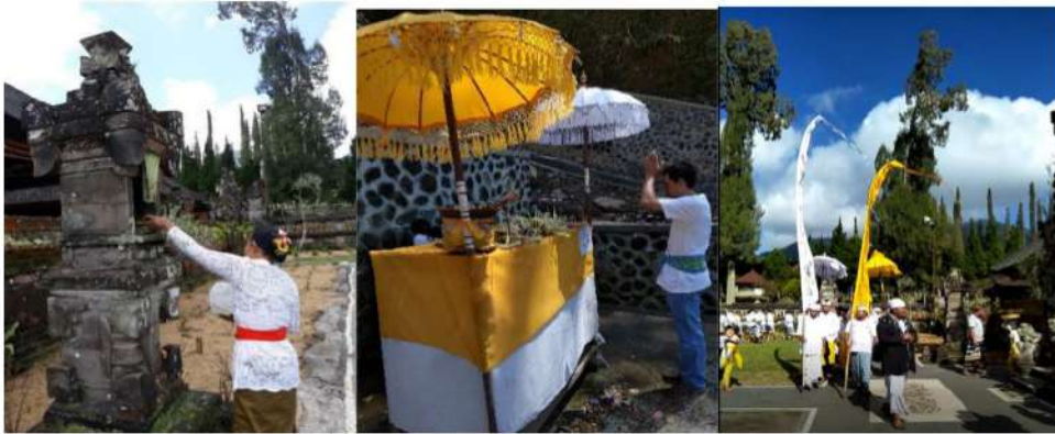
Gambar 1. Pelaksanaan upacara ritual keagamaan.

Berdasarkan hasil penelitian yang dilakukan, diketahui bahwa di Bedugul Bali secara umum terdapat IOI spesies tumbuhan yang digunakan dalam ritual keagamaan Hindu-Bali. Data menunjukkan bahwa masyarakat Hindu-Bali menggunakan tumbuhan tersebut berdasarkan pada kepercayaan masyarakat terhadap tumbuhan tertentu yang digunakan dalam pelaksanaan ritual keagamaan yang dilakukan secara turun temurun.