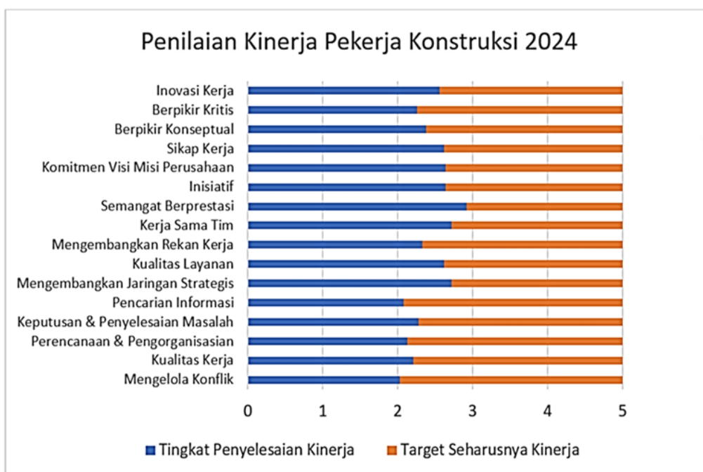
Gambar 1 Penilaian Kinerja Pekerja Konstruksi Tahun 2024

ditetapkan perusahaan akan memberikan dampak terhadap produktivitas seperti yang terjadi pada pekerja konstruksi pada salah satu perusahaan konstruksi di Kabupaten Gresik yang memiliki rata-rata penilaian kinerja belum baik dan belum sesuai dengan standar yang diinginkan perusahaan. Berikut penilaian kinerja pekerja konstruksi: