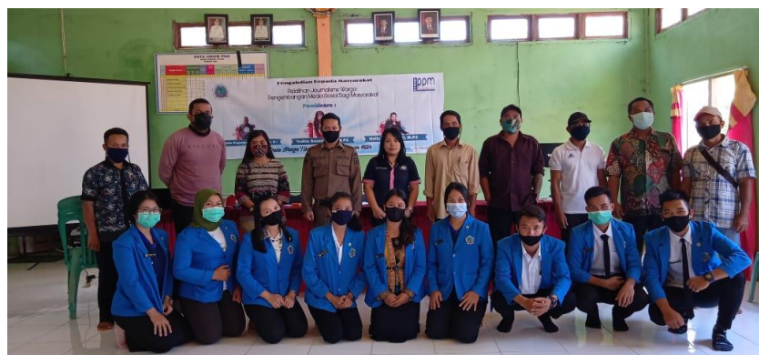
Gambar 3. Peserta pelatihan

dengan sesi tanya jawab dan masukan yang dilakukan oleh peserta dengan dipandu oleh moderator. Salah satu peserta menanyakan bagaimana mengontrol penggunaan handphone oleh anak agar tidak terlampau batas, kemudian pertanyaan itu dapat dijawab dengan baik oleh pemateri. Beberapa peserta memberi masukan agar kegiatan seperti penyuluhan dan pelatihan ini agar lebih sering dilakukan sebagai wadah penambahan informasi bagi masyarakat.