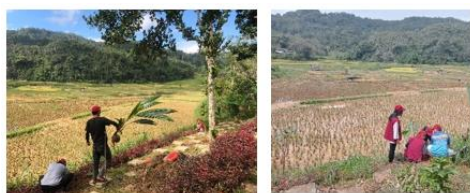
Gambar 4. Penanaman Pohon Pinang, Kelapa dan Bunga Krokot Merah

Adapun potensi keberlanjutan dari penanaman pohon pinang, kelapa dan bunga krokot merah yaitu peningkatan estetika dan keindahan, dengan adanya penanaman dapat meningkatkan nilai keindahan tersendiri bagi objek wisata tersebut. Dengan adanya keindahan ini akan menarik perhatian pengunjung pada objek wisata tersebut.