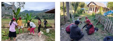
Gambar 2. Pembuatan dan Perbaikan Sarana dan Prasarana Objek Wisata Sawah Lukis

Adapun potensi keberlanjutan dari perbaikan sarana dan prasarana yaitu perawatan dan pemeliharaan, diperlukan adanya pendirian untuk melakukan pemeliharaan berkala dan rutin untuk memastikan bahwa fasilitas yang dibuat bahkan diperbaiki tetap terjaga dengan baik.