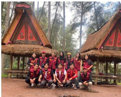
Gambar 1. Studi Banding di Objek Wisata Pinus Buntu Datu

Adapun hasil dari Studi Banding sebagai berikut: