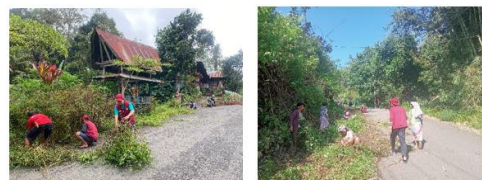
Gambar 3. Kegiatan Membersihkan Lokasi

Adapun potensi keberlanjutan dari kegiatan pembersihan lingkungan sekitar objek wisata yaitu perawatan dan pemeliharaan berkala, dalam kawasan objek wisata diperlukan adanya perawatan dan pemeliharaan rutin setelah melakukan pembersihan. Kegiatan yang dimaksud seperti pengangkatan sampah, pemeliharaan bunga, pemangkasan rumput.