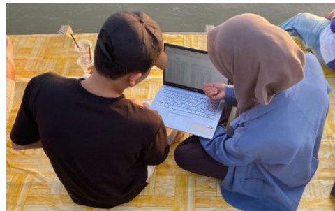
Gambar 4. Proses Penginputan Transaksi Kedai Kopi 76