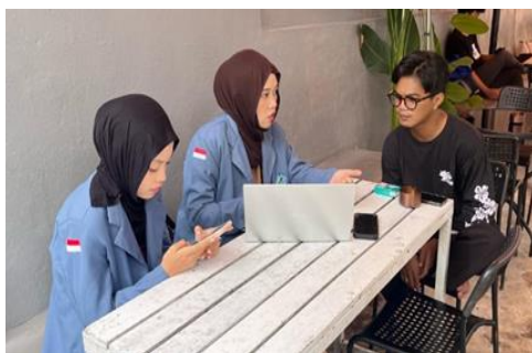
Gambar 11. Penilaian dan Evaluasi Kinerja UMKM Kopi 76

kesalahan klasifikasi dari transaksi harian pada 40% menjadi 15%. Meskipun pendampingan hanya dilakukan dalam satu hari, mitra sudah dapat melakukan pencatatan hingga menghasilkan laporan keuangan selama kurang lebih 2 jam. Hal ini merupakan pencapaian yang signifikan mengingat sebelumnya pemilik Kedai Kopi 76 belum pernah menyusun laporan keuangan sama sekali.