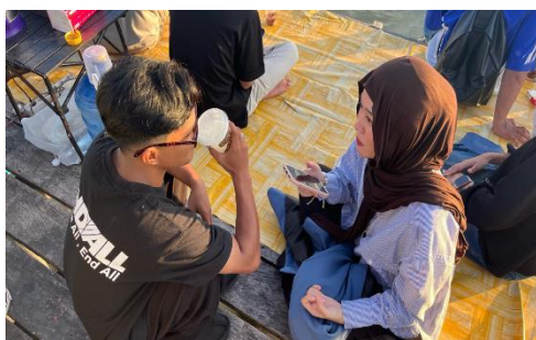
Gambar 1. Diskusi Bersama Pemilik Kedai Kopi 76

pencatatan keuangan yang pernah dihadapi pemilik. Forum tanya jawab dibuka untuk mengukur pemahaman mitra terhadap materi yang telah dipaparkan. Diskusi difokuskan pada permasalahan spesifik dalam manajemen keuangan di Kedai Kopi 76, seperti terlihat pada (Gambar 2) yang menggambarkan proses diskusi bersama pemilik.