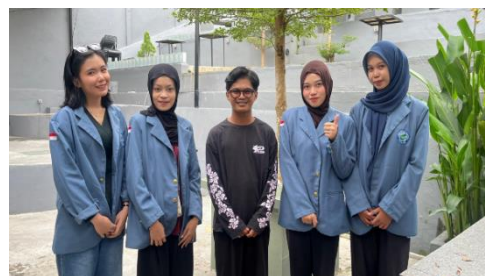
Gambar 12. Foto Bersama dengan Pemilik Kedai Kopi 76

Umpan balik dari mitra juga menunjukkan bahwa materi yang disampaikan sangat relevan dan mitra juga menjadi lebih percaya diri untuk mengambil keputusan bisnis berdasarkan data. Untuk keberlanjutan, kami merekomendasikan pembuatan panduan dengan visual, pelatihan lanjutan analisis data (grafik, Pivot Table), dan pembentukan grup WhatsApp untuk konsultasi lanjutan. Model pelatihan diharapkan dapat direplikasi bagi UMKM lain di wilayah terpencil, dengan penyesuaian template Excel sesuai kebutuhan usaha. Keberhasilan kegiatan ini tidak hanya mendukung efisiensi operasional, tetapi juga membuka peluang untuk akses pendanaan dan pengembangan usaha berkelanjutan.