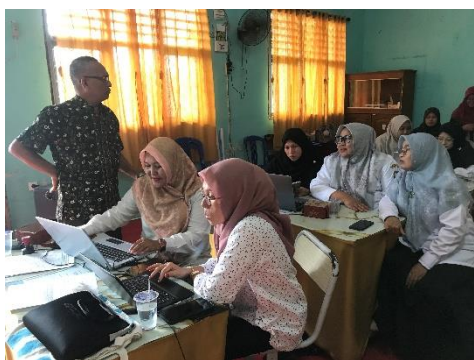
Gambar 3. Kegiatan Pelaksanaan Pelatihan

Keberhasilan pelatihan ini menjadi dasar untuk rencana pengembangan ke