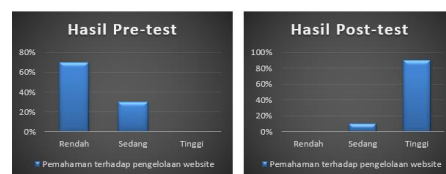
Gambar 4. Hasil Pre-test dan post-test pelatihan website

merencanakan membuat aplikasi web dalam upaya pencegahan dan penanganan kekerasan disekolah sejak dua tahun lalu, namun belum terealisasi. Kendala yang sering dihadapi guru yakni keterbatasan terhadap pembuatan aplikasi dan cara pengoprasisannya.