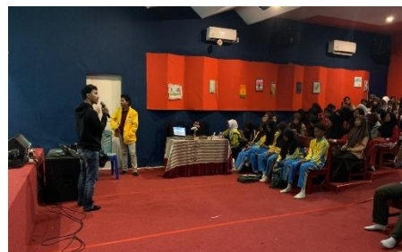
Gambar 6. Penerapan Teknologi

penerapan teknologi dapat dilihat pada gambar berikut: