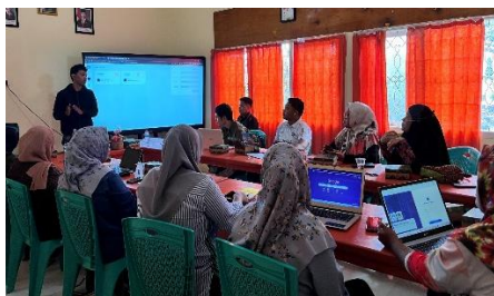
Gambar 5. Pelatihan Penggunaan Website