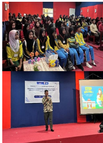
Gambar 2. Penyuluhan Bahaya bullying

dalam perilaku bullying. Anggota osis sekolah pun merasa berterimakasih karena mereka baru membentuk tim gugus pencegahan kekerasan di SMA Negeri 5 Tidore Kepulauan.