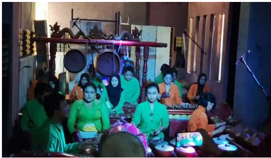
Gambar 5. Kegiatan Karawitan

mengenal budaya Indonesia dan melestarikan budaya. Karawitan juga memiliki nilai-nilai yang bisa diambil oleh peserta didik saat memainkannya (Aulia et al., 2021). Melalui karawitan peserta didik tidak hanya mengasah keterampilan pada bidang seni namun juga membentuk karakter sesuai Profil Pelajar Pancasila dan memperkuat identitas budaya yang mereka miliki.