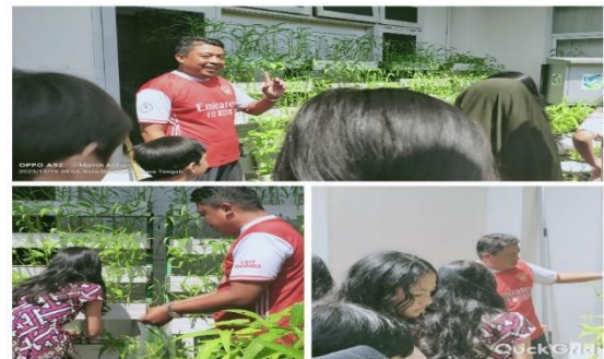
Gambar 3. Merawat Tanaman Kangkung

Setelah media tanam sudah terisi tanah, peserta didik menaburkan benih kangkung untuk ditanam. Proses penyiraman tanaman menjadi salah satu yang terpenting dalam perawatan tanaman kangkung. Peserta didik merawat tanaman kangkung dengan menyiramnya secara rutin agar tanaman kangkung mendapatkan air yang cukup supaya tanaman berkembang secara optimal.