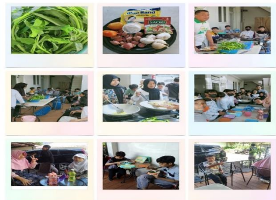
Gambar 4. Mengolah Hasil Pertanian

Setelah tanaman kangkung siap untuk dipanen, peserta didik akan melakukan proses pemanenan bersama-sama. Hasil dari panen tersebut akan dimanfaatkan untuk kegiatan memasak dan makan bersama yang dilakukan dengan para tutor sehingga peserta didik dapat menikmati hasil dari usaha yang telah dilakukan.