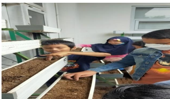
Gambar 2. Menanam Benih Kangkung

Dalam proses menanam kangkung peserta didik memulai dengan menyiapkan media tanam, mengisinya dengan tanah dan kompos supaya kaya nutrisi ditambahkan dengan Microbacter Alfaafa (MA-11) yang bisa meningkatkan kesuburan. Microbacter Alfaafa (MA-11) dalam pembuatan kompos dapat meningkatkan efisiensi dan hasil pertanian organik karena memperbaiki struktur tanah, memberikan nutrisi penting untuk tanaman dan mendorong pertumbuhan kangkung yang lebih sehat dan produktif.