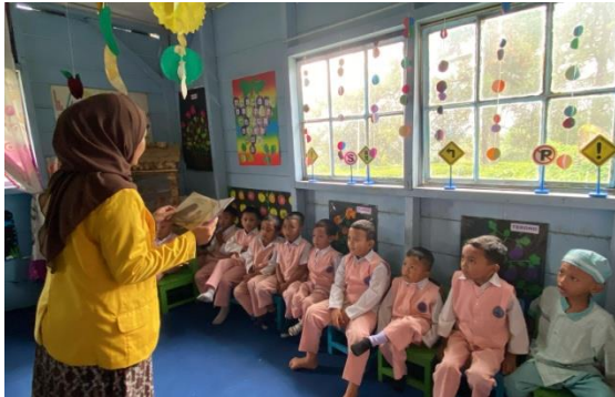
Gambar 1. Dokumentasi Penelitian

Variabel bebas (X), Metode bercerita, yaitu kegiatan menyampaikan cerita secara lisan kepada anak-anak dengan tujuan menanamkan nilai-nilai moral. Variabel terikat (Y), Moral anak usia dini, yang mencakup pemahaman nilai kejujuran, kesabaran, sopan santun, kepatuhan, ketekunan, ketenangan, dan pemahaman agama, diukur melalui perubahan perilaku anak yang diamati menggunakan instrumen checklist. Analisis data dilakukan dengan pendekatan deskriptif kuantitatif dan deskriptif kualitatif. Data kualitatif dari observasi dianalisis untuk mengevaluasi perubahan perilaku anak secara deskriptif. Refleksi terhadap hasil observasi digunakan untuk menentukan keberlanjutan tindakan ke siklus berikutnya.