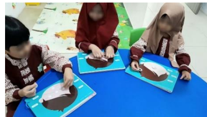
Gambar 10. Dokumentasi Tahap One-To-One Evaluation

Pada tahap one-to-one evaluation diperoleh skor maksimal sebesar 40. Nilai anak dihitung dengan membagi skor yang diperoleh dengan skor maksimal, kemudian dikalikan 100%. Dari perhitungan tersebut, nilai rata-rata yang didapatkan adalah 89%, yang dikategorikan sebagai sangat praktis.