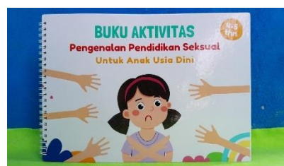
Gambar 1. Cover Depan

Berdasarkan tabel rekapitulasi, hasil perolehan skor validasi materi sebesar 96% dengan kategori sangat valid. Selanjutnya hasil validasi media memperoleh skor sebesar 98% dengan kategori sangat valid. Dari kedua aspek yang dinilai oleh validator, rata-rata skor hasil pada tahap expert review adalah 97% dan dinyatakan sangat valid dan layak uji coba dengan revisi sesuai saran. Berikut ini tampilan media activity book pendidikan seksual yang telah divalidasi: