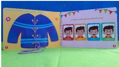
Gambar 6. Halaman Materi 5