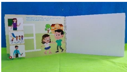
Gambar 7. Halaman Materi 6