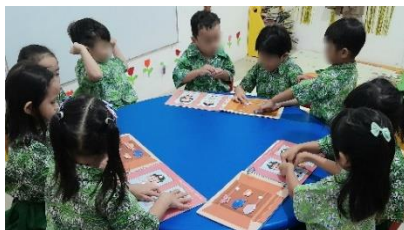
Gambar 11. Dokumentasi Tahap Small Group Evaluation

Hasil observasi anak usia 4-5 tahun terhadap penggunaan media activity book pendidikan seksual pada tahap small group evaluation dengan menggunakan 10 indikator secara keseluruhan memperoleh rata-rata skor sebesar 93% dengan kategori sangat praktis. Berdasarkan uji coba pada 9 anak, media activity book pendidikan seksual terbukti memiliki tingkat kepraktisan yang sangat tinggi.