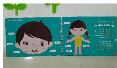
Gambar 3. Halaman Materi 1 dan Materi 2