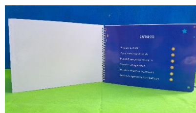
Gambar 2. Halaman Daftar Isi