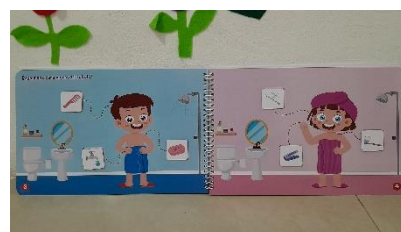
Gambar 4. Halaman Materi 3