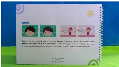
Gambar 8. Cover Belakang