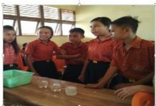
Gambar 7. Siswa menyiapkan alat dan bahan percobaan

menyiapkan alat dan bahan percobaan tentang membandingkan hasil pengukuran termometer buatan dengan termometer laboratorium berdasarkan langkah kerja pada LKS. Pada tahap membuat perencanaan dan regulasi diri dipertemuan pertama siswa masih diarahkan oleh guru untuk menentukan alat dan bahan yang akan digunakan sesuai percobaan dan dipertemuan kedua siswa sudah mampu membuat perencanaan dan regulasi diri seperti pada Gambar 7.