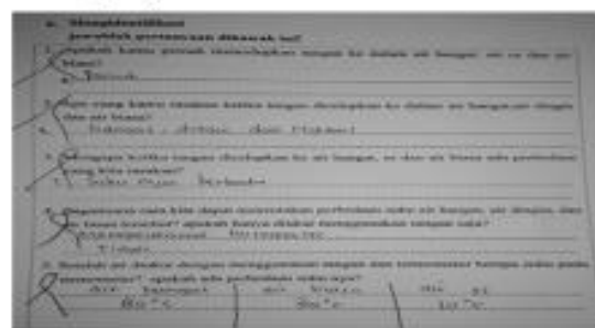
Gambar 1. Hasil Jawaban Siswa

dicelupkan ke dalam air hangat, dingin dan biasa? Mengapa ketika tangan dicelupkan ada perbedaan yang dirasakan? Siswa menjawab karena suhunya berbeda. Guru merespon hasil diskusi siswa dengan memberikan penegasan terhadap jawaban siswa (hasil diskusi), dari hasil demonstrasi tadi terjadi perbedaan yang kita rasakan ketika tangan dicelupkan ke dalam air hangat, dingin dan biasa hal itu disebabkan karena adanya perubahan suhu. Hasil jawaban siswa dapat dilihat pada Gambar 1.