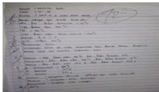
Gambar 11. Hasil Kerja Siswa

soal latihan. Hasil kerja siswa dapat dilihat pada Gambar 11.