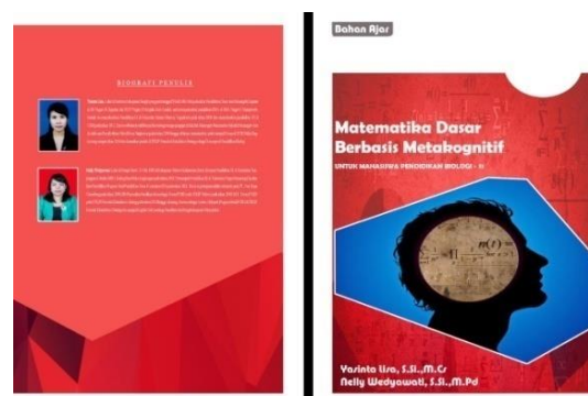
Gambar 2. Cover e-book Matematika Dasar Berbasis Metakognitif

Sampul e-book didesain dengan memperhatikan karakteristik mata kuliah Matematika diantaranya memasukkan symbol-simbol matematika serta gambar kepala manusia yang menggambarkan konsep berfikir matematika seperti yang ditampilkan pada Gambar 2.