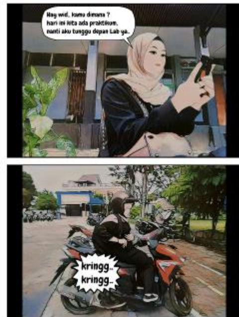
Gambar 2. Desain Bahan Ajar Komik Digital pada Materi Gerak