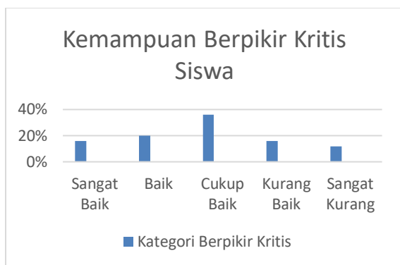
Gambar 1. Persentase Tingkat Kemampuan Berpikir Kritis Siswa

Selanjutnya, dilakukan analisis terhadap jawaban tiga siswa yang mewakili kategori sangat baik, cukup baik, dan kurang. Analisis ini bertujuan menelaah sejauh mana hasil pengerjaan soal masing-masing siswa mencerminkan indikator kemampuan berpikir kritis, yaitu interpretasi, analisis, evaluasi, dan inferensi. Hasil jawaban ketiga siswa dalam menyelesaikan soal volume kubus dan balok disajikan sebagai berikut.