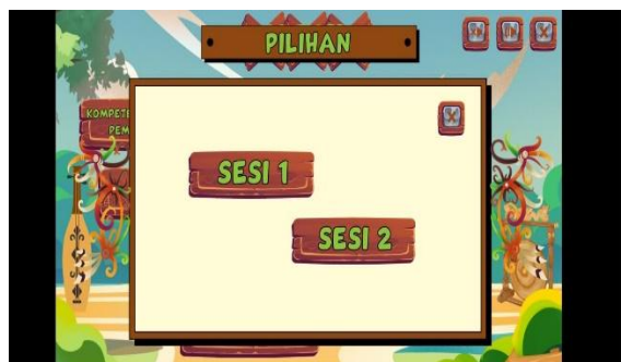
Gambar 7. Tampilan Menu Quiz

Sedangkan pada menu Quiz berisi soal-soal materi Bilangan Bulat dan Bilangan Pecahan yang masing-masing sesi berisi 20 soal sebagai latihan untuk meningkatkan numerasi siswa. Quiz digunakan karena sebagai alat evaluasi kemampuan numerasi dan penguatan ( reinforcement ) setelah eksplorasi konsep. Pada Quiz kemampuan numerasi yang ingin ditingkatkan yaitu melatih ketepatan perhitungan, interpretasi soal kontekstual, dan pengambilan keputusan berbasis hasil perhitungan.