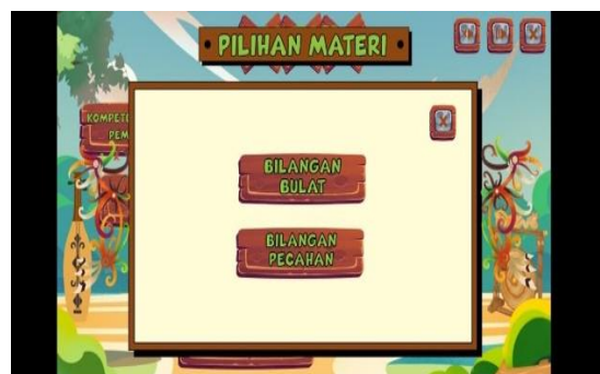
Gambar 3. Tampilan Menu Materi

Menu materi digunakan untuk memberikan scaffolding konsep sebelum siswa masuk ke aktivitas numerasi. Dalam menu materi terdapat dua pilihan yaitu Bilangan Bulat dan Bilangan Pecahan. Dengan latar belakang berupa kecapi dan gong ditambah dengan ornamen ukiran khas Masyarakat Dayak Kalimantan Tengah. Tampilan pada menu materi dapat dilihat sebagai berikut.