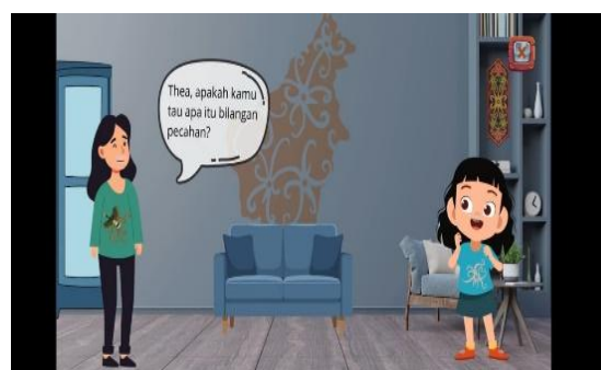
Gambar 5. Penjelasan Bilangan Pecahan

Melalui dialog karakter pada Materi, kemampuan numerasi yang ingin ditekankan adalah melatih pemahaman konsep dan penerapannya dalam situasi nyata. Berikut tampilan untuk penjelasan materi Bilangan Pecahan