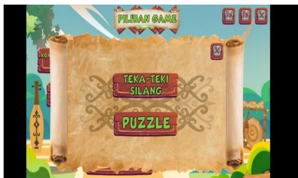
Gambar 6. Tampilan Menu Game

Sedangkan pada menu Quiz berisi soal-soal materi Bilangan Bulat dan Bilangan Pecahan yang masing-masing sesi berisi 20 soal sebagai latihan untuk meningkatkan numerasi siswa. Quiz digunakan karena sebagai alat evaluasi kemampuan numerasi dan penguatan ( reinforcement ) setelah eksplorasi konsep. Pada Quiz kemampuan numerasi yang ingin ditingkatkan yaitu melatih ketepatan perhitungan, interpretasi soal kontekstual, dan pengambilan keputusan berbasis hasil perhitungan.