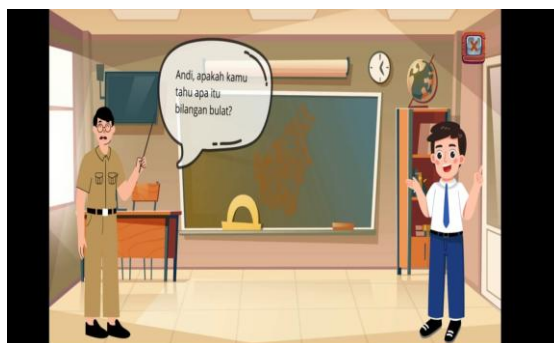
Gambar 4. Penjelasan Bilangan Bulat

peta Pulau Kalimantan untuk mencirikan kearifan lokal Kalimantan Tengah. Bentuk numerasi atau perwujudan nyata dalam kehidupan sehari-hari yang diintegrasikan kearifan lokal Kalimantan Tengah untuk membelajarkan materi Bilangan Bulat berupa kegiatan Manunggal (tradisi menanam padi secara tradisional yang dilakukan Masyarakat Dayak). Tampilan untuk penjelasan materi Bilangan Bulat sebagai berikut.