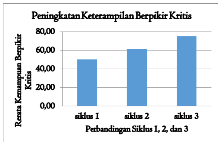
Gambar 2. Diagram peningkatan keterampilan berpikir kritis mahasiswa

Berdasarkan Tabel 3 menunjukkan bahwa keterampilan berpikir kritis mahasiswa meningkat dari siklus I ke siklus 2 dan dari siklus 2 ke siklus 3. Hal itu ditunjukkan dengan nilai rerata keterampilan berpikir kritis siklus I sebesar 50,09, siklus 2 sebesar 61,69, dan siklus 3 sebesar 75,09. Informasi tentang peningkatan rerata keterampilan berpikir kritis mahasiswa pada masing-masing siklus dapat diperjelas melalui Gambar 2 .