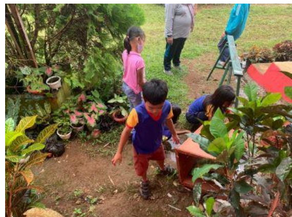
Gambar 6. Senam pagi dan Giat bersih lingkungan

Dari selama 20 minggu pelaksanaan kampus mengajar di sekolah tersebut, guru pamong melakukan review terhadap pekerjaan mahasiswa dalam hal pembelajaran di kelas dan online