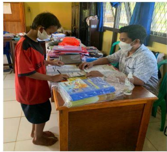
Gambar 3. Pembelajaran tatap muka (PTM) dan penugasan secara luring kepada kelas atas