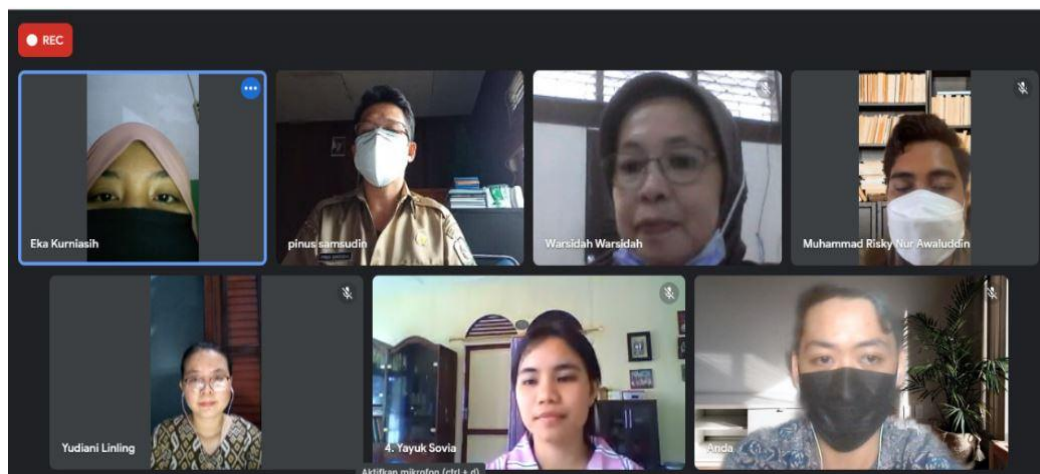
Gambar 1. Penyerahan Tim KM2 dan kepada Kepala Dinas Pendidikan Kabupaten Bengkayang dan kepada pihak Sekolah.

penyerahan kepada pihak sekolah SDN No 05 Sejahah secara daring karena kondisi darurat Pemberlakuan Pembatasan Kegiatan Masyarakat (PPKM). Penyerahan ini disertai dengan penyampaian informasi program kepada kepala dinas Pendidikan dan pihak sekolah juga terkait dengan tugas-tugas pokok mahasiswa selama berkegiatan selama 20 minggu.