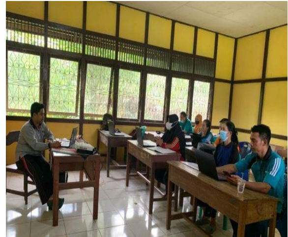
Gambar 5. Pembuatan buku tamu dan penginputan nilai bersama-sama dengan guru sekolah

Selain 3 tugas pokok yang dilaksanakan di sekolah, peserta program KM 2 juga dapat melaksanakan kegiatan-kegiatan penunjang di sekolah, seperti kegiatan ekstrakurikuler dengan melatih siswa berbakat dalam