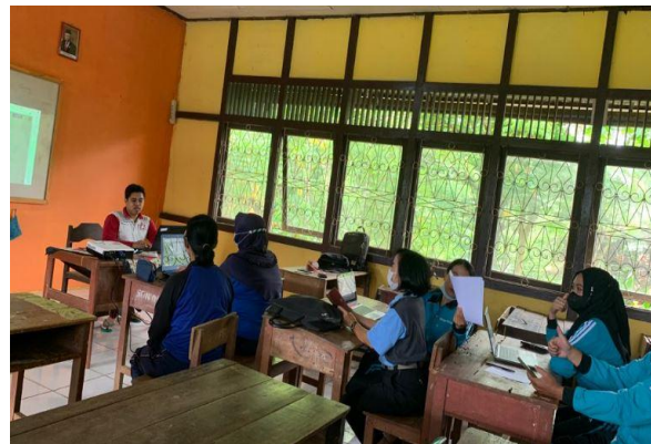
Gambar 4. Adaptasi teknologi pada siswa dan guru di sekolah

Adaptasi teknologi yang dilakukan oleh Tim KM2 di sekolah SDN No 05 Sejah dilakukan kepada siswa dan guru sekolah, meliputi penulisan dan pengiriman dokumen di whatsapp, membuat kelas pembelajaran google (Google Classroom), membuat modul sederhana untuk penugasan pada siswa, dan beberapa adaptasi teknologi lainnya yang penting untuk diketahui dan diterapkan dalam proses pembelajaran tatap muka di kelas ataupun online.