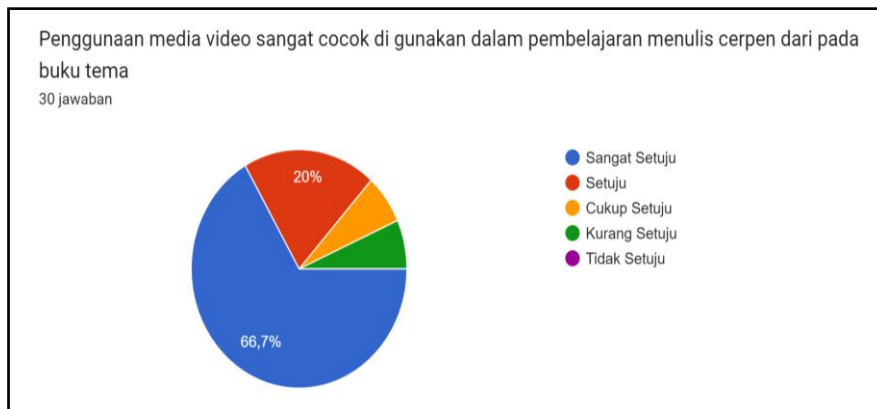
Gambar 3. Penggunaan Media Video untuk Pembelajaran Menulis Cerpen

melalui kuesioner tersebut bahwa 40% kurang setuju dan 16,7% setuju. Selanjutnya pada hasil respon siswa terhadap penggunaan media video dalam pembelajaran menulis cerpen dapat dilihat pada Gambar 3.