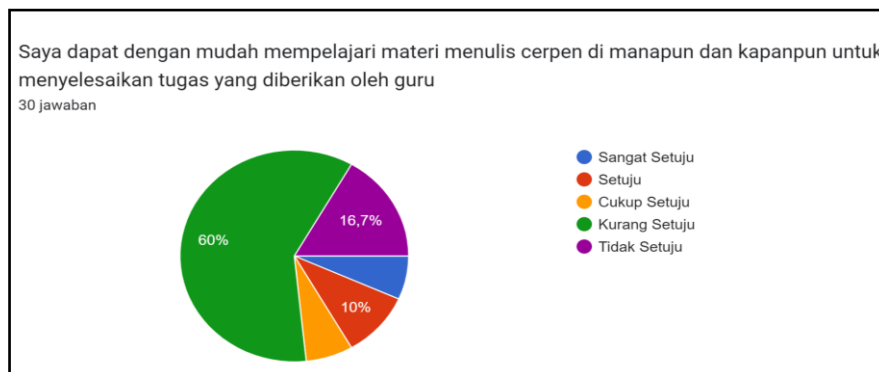
Gambar 4. Penggunaan Media Pembelajaran Secara Blended Learning

Peserta didik berpendapat melalui kuesioner tersebut bahwa 66,7% berpendapat sangat setuju dan 6,7% kurang setuju. Selanjutnya hasil angket mengenai penggunaan media pembelajaran interaktif berpadukan blended learning , ditampilkan pada Gambar 4.