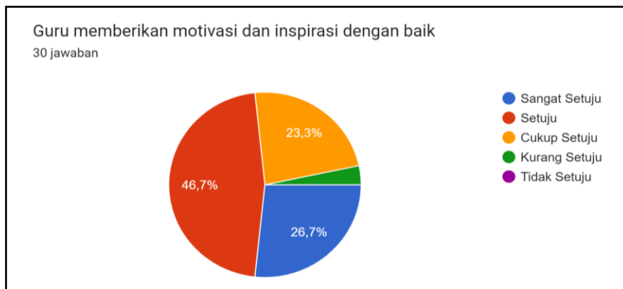
Gambar 1. Sikap Guru Dalam Proses Pembelajaran

menulis cerpen. Hasil analisis kebutuhan terhadap penggunaan video interaktif berpadu metode blended learning pada materi menulis cerpen kelas V Sekolah Dasar terlihat pada Gambar 1.