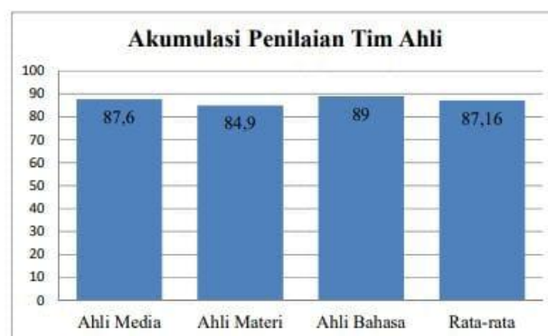
Gambar 3. Rekapitulasi Penilaian Tim Ahli

kelas I SD Negeri Cilaku. Hasil rekapitulasi penilaian tim ahli diperoleh skor rata-rata 87,16%. Adapun hasil rekapitulasi penilaian tim ahli dapat dipaparkan melalui diagram seperti tersaji pada Gambar 3 berikut.