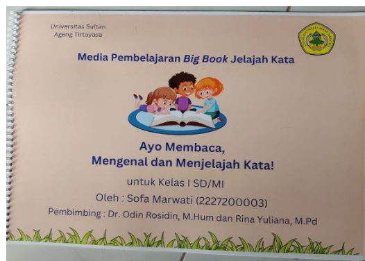
Gambar 2. Tampilan Media Pembelajaran Big Book Jelajah Kata

mengenal huruf vokal, mengenal huruf konsonan, mengenal gabungan huruf vokal, mengenal gabungan huruf konsonan, menjelajah huruf alfabet kapital, menjelajah huruf alfabet nonkapital, mengenal suku kata, menjelajah suku kata, mengenal kata, menjelajah kata, mengenal dan menjelajah kalimat sederhana, cara perawatan media pembelajaran big book jelajah kata, glosarium, daftar pustaka, profil penulis, profil pembimbing, dan cover belakang.