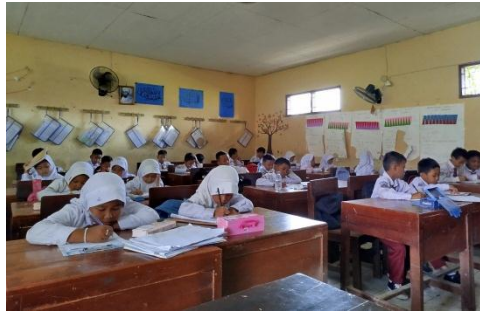
Gambar 4. Tahap Evaluasi

secara visual dapat dilihat pada Gambar 4.