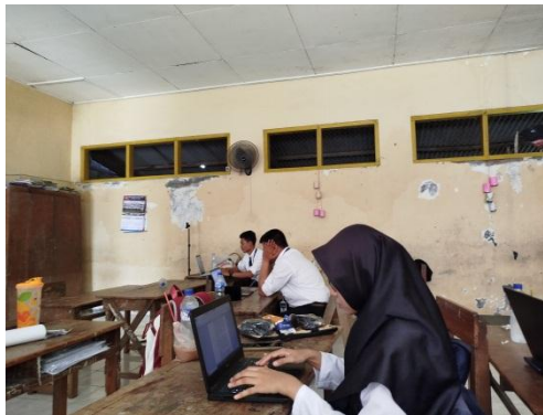
Gambar 2. Tahap Perencanaan

tingkat perkembangan siswa kelas 3. Menyusun pertanyaan-pertanyaan pemantik yang mendorong siswa untuk berpikir kritis dan menganalisis teks. Merancang aktivitas diskusi kelompok yang memungkinkan siswa untuk saling berbagi pandangan dan ide-ide mereka mengenai teks yang dibaca. Menyusun alat evaluasi yang dapat mengukur peningkatan kemampuan berpikir kritis siswa, baik melalui observasi, tes, maupun hasil diskusi. Adapun kegiatan perencanaan secara visual dapat dilihat pada Gambar 2.