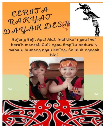
Gambar 2. Tampilan Buku Saku Cerita Rakyat

Saku Cerita Rakyat Sub Suku Dayak Desa. Adapun tampilan akhir dari buku saku dapat dilihat pada Gambar 2.