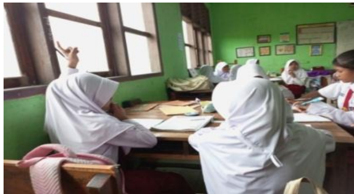
Gambar 3. Anak Disgrafia Mengangkat Tangan Saat Guru Bertanya

nonverbal. Komunikasi nonverbal yang dilakukan ialah mengangkat satu tangannya ke atas, bertepuk tangan dan menggelengkan kepalanya pada saat pembelajaran.