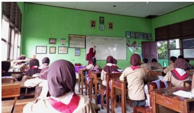
Gambar 2. Guru Menggunakan Media Pembelajaran Berupa Papan Tulis