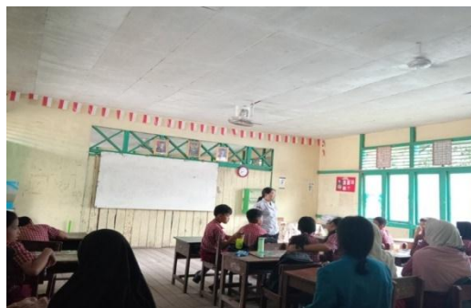
Gambar 2. Proses Pembelajaran

Terlihat bahwa dalam proses pembelajaran, peserta didik lebih banyak melibatkan gaya belajar auditori, ditandai dengan fokus pada penjelasan guru secara lisan dan aktivitas mendengarkan sebagai sarana utama dalam memahami materi.