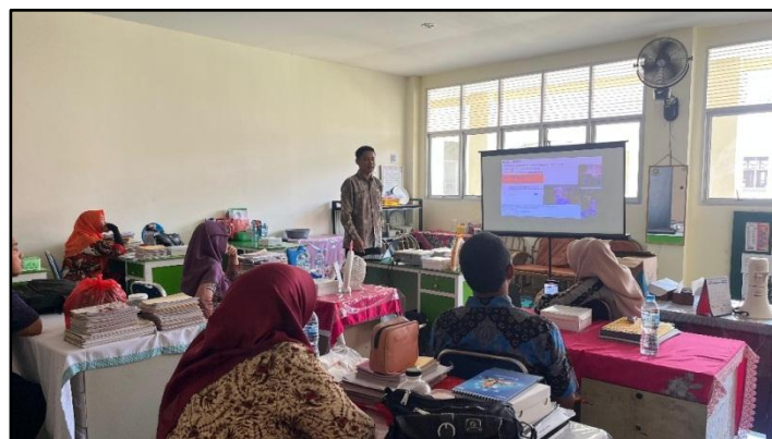
Gambar 5. Evaluasi dan Tindak Lanjut

memotivasi guru pasca-supervisi dengan menekankan tujuan membantu guru menjadi lebih baik, bukan mencari kesalahan. Pendekatan sebagai rekan sejawat berhasil membangun rasa percaya diri guru dan mengurangi kecemasan. Hasil supervisi juga dimanfaatkan untuk pengembangan kebijakan sekolah secara makro melalui pembahasan dalam rapat evaluasi bersama waka kurikulum dan perwakilan guru, sehingga sekolah dapat merancang program pengembangan guru yang lebih sistematis dan berjenjang.