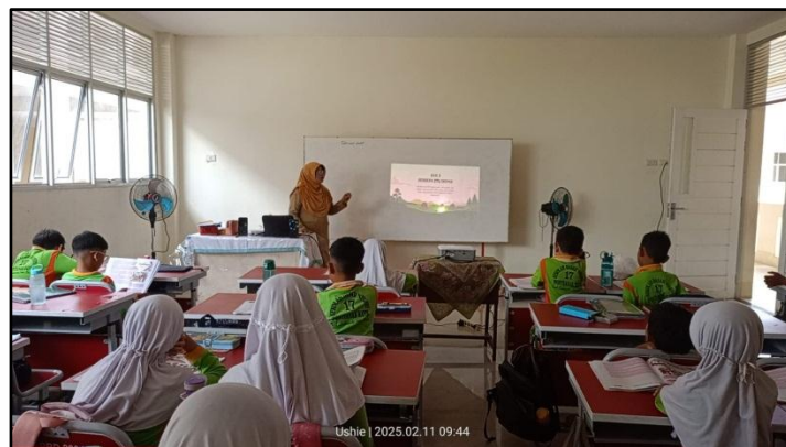
Gambar 4. Pelaksanaan Supervisi Kelas

guru, serta kesesuaian dan kreativitas dalam penerapan metode dan media pembelajaran. Selama observasi, kepala sekolah tidak hanya duduk di belakang, tetapi memperhatikan bagaimana guru mengelola kelas, berinteraksi dengan siswa, dan menanggapi berbagai situasi pembelajaran, menunjukkan bahwa supervisi berfokus pada proses dan dampak pembelajaran pada peserta didik.