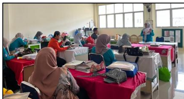
Gambar 2. Rapat Perencanaan Supervisi

pada kebijakan formal dari Dinas Pendidikan dan Kebudayaan yang dipadukan dengan partisipasi kolaboratif seluruh warga sekolah. Kepala sekolah sebagai penanggung jawab utama menegaskan bahwa supervisi akademik merupakan tanggung jawab inti untuk memastikan proses pembelajaran berjalan sesuai standar yang ditetapkan. Visi sekolah tentang pembelajaran yang berkarakter dan berdaya saing menjadi landasan filosofis yang mengarahkan kebijakan supervisi kepada pembinaan guru agar mampu melaksanakan pembelajaran yang aktif, inovatif, dan menyenangkan.