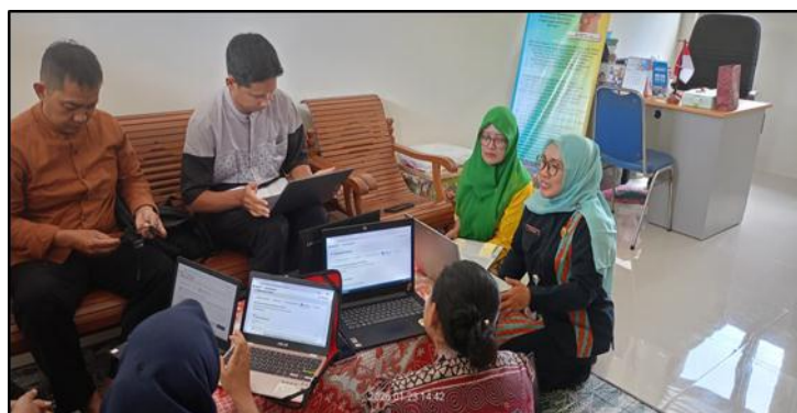
Gambar 3. Koordinasi Perencanaan Supervisi Lanjutan

melainkan dilibatkan secara aktif dalam penyusunan rencana melalui forum rapat dewan guru. Keterlibatan ini bertujuan menciptakan suasana terbuka dan menghilangkan rasa takut di kalangan guru, sehingga perencanaan berubah dari instruksi satu arah menjadi proses dialogis yang mempertimbangkan masukan dan kondisi nyata para pelaksana di lapangan. Kepala sekolah juga menyiapkan sarana pendukung seperti buku catatan khusus untuk mendokumentasikan hasil observasi dan rekomendasi perbaikan, serta instrumen observasi yang mengacu pada pedoman dinas maupun yang disesuaikan dengan kondisi sekolah.