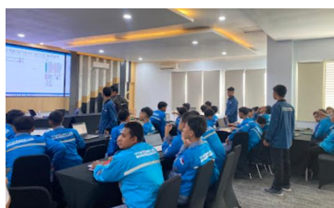
Gambar 2. Mahasiswa Membantu Dalam Proses Pelatihan

Selain itu, keberhasilan dari kegiatan pelatihan ini terlihat dari hasil kuesioner yang telah diisi setelah pelatihan dilakukan. Hasil kuesioner dapat menyimpulkan bahwa siswa mampu memahami dasar dari SCADA yang merupakan wawasan baru yang belum pernah didapat di sekolah. Keantusiasmean siswa dan guru juga terlihat dari keinginan mengenai pelatihan lanjutan agar dapat lebih memahami dan menguasai teknologi SCADA lebih lengkap.