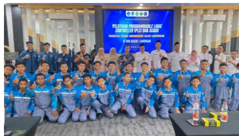
Gambar 1. Kegiatan Pelatihan Dibuka Dengan Foto Bersama Antara Kepala Sekolah SMKN 1 Lamongan Beserta Siswa-Siswa, Guru, Tim, dan Mahasiswa

Pelatihan PLC Outseal dan SCADA Haiwell telah berhasil dan sukses dilaksanakan di SMKN 1 Lamongan. Kegiatan pelatihan dibuka dengan sambutan dari Kepala Sekolah SMKN 1 Lamongan dan foto bersama. Gambar 1 memperlihatkan foto bersama dengan peserta yakni siswa SMKN 1 Lamongan, guru, tim pengabdian termasuk mahasiswa yang menandakan bahwa pelatihan siap dilakukan dengan sukacita. Hal ini terlihat dari antusiasme siswa-siswa maupun guru dari SMKN 1 Lamongan. Dalam pelatihan ini, mahasiswa UNISLA juga dilibatkan dan membantu dalam proses pelatihan ketika siswa SMK mengalami kesulitan dalam mengoperasikan program PLC Outseal maupun SCADA Haiwell, dapat dilihat pada Gambar 2.