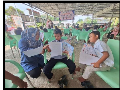
Gambar 4. Pembimbingan Membaca

Dengan adanya tahapan-tahapan ini, diharapkan bahwa kegiatan pengabdian ini dapat terus memberikan manfaat bagi masyarakat Desa Terak, khususnya dalam meningkatkan literasi, serta mengurangi angka buta aksara yang ada.