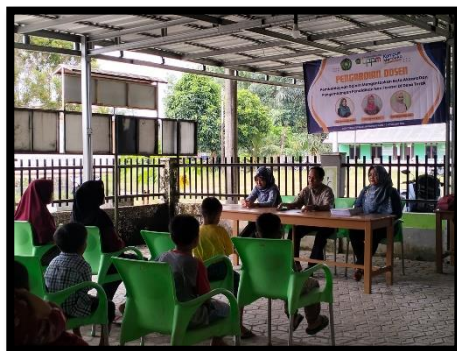
Gambar 2. Talkshow Inspiratif Pendidikan