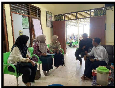
Gambar 1. Pertemuan dengan Kades Terak

tersebut, peserta diminta untuk membaca huruf. Jika sudah mengetahui huruf, maka akan diteruskan untuk membaca suku kata hingga membaca kalimat dengan bimbingan tim pengabdian. Pelatihan ini bertujuan untuk mengajarkan keterampilan membaca.