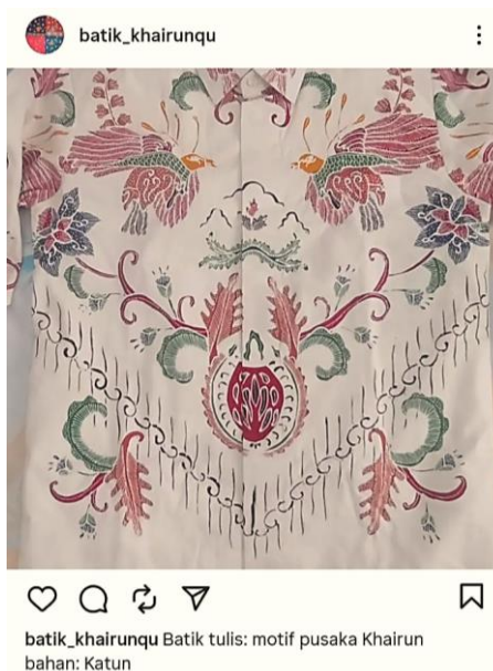
Gambar 4. Platform digital di media sosial

Promosi batik KhairunQu dilakukan melalui strategi ganda, yaitu menggabungkan pemanfaatan media digital dengan keterlibatan publik secara langsung dalam pameran dan ekspos. Platform digital seperti media sosial (Gambar 4) dan kampanye daring memainkan peran penting dalam membangun visibilitas dan menciptakan komunikasi interaktif dengan khalayak luas. Promosi digital memungkinkan penjangkauan yang hemat biaya dan memberikan peluang untuk bercerita yang meningkatkan hubungan emosional dengan konsumen (Suhairi et al., 2023). Dalam praktiknya, kampanye digital batik KhairunQu terbukti efektif, karena menjangkau lebih dari 300 pengunjung dari berbagai daerah di Indonesia. Pemanfaatan media sosial untuk menampilkan motif-motif seperti burung paok, cendrawasih Halmahera, cakalang, cengkeh, pala, dan bunga telang memastikan bahwa desain batik tidak hanya diperkenalkan secara lokal tetapi juga dipromosikan secara nasional, sehingga memperluas pengakuan mereka di luar Maluku Utara.