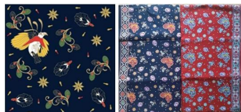
Gambar 2. Batik Bidadari Halmahera

Selain variasi motif yang terinspirasi oleh flora dan fauna, sebuah karya khas yang dikenal sebagai bidadari Halmahera diciptakan menggunakan teknik batik tulis (Gambar 2). Berbeda dengan batik cap atau cetak, batik tulis dikenal karena prosesnya yang padat karya dan membutuhkan tingkat keterampilan, kesabaran, dan keterampilan artistik yang tinggi (Paramita et al., 2022). Setiap garis dan ornamen pada bidadari Halmahera diaplikasikan dengan cermat menggunakan canting, menghasilkan desain yang tidak dapat ditiru secara persis, sehingga meningkatkan keaslian dan keunikannya.