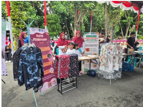
Gambar 5. Stand di Unkhair Creative Products Expo

indra dan emosi sangat penting dalam mempromosikan produk budaya, dan respons terhadap batik KhairunQu menunjukkan efektivitas strategi ini.