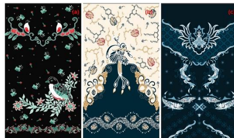
Gambar 1. Motif batik: (a) Burung Paok, (b) Bahan kimia alam lokal, dan (c) Cakalang.

Dari eksplorasi ini, beberapa motif batik tercipta dengan merek KhairunQu Batik. Burung Paok dikembangkan menjadi motif yang melambangkan ketahanan dan keunikan daerah (Gambar 1.a). Unsur alami lokal tersebut diwujudkan dalam desain yang menonjolkan keanekaragaman hayati eksotis di wilayah tersebut (Gambar 1.b). Cakalang, sumber daya laut yang menjadi pusat kehidupan masyarakat setempat, menginspirasi sebuah motif yang merepresentasikan budaya maritim Maluku Utara (Gambar 1.c).