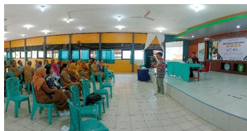
Gambar 2. Pemaparan Materi dari Tim PKM

kuesioner menunjukkan bahwa seluruh peserta menilai materi sangat relevan, 97% merasa lebih percaya diri mengajarkan literasi keuangan, dan 85% menyatakan ketertarikan untuk membuka rekening efek dalam waktu dekat. Sebagian besar peserta