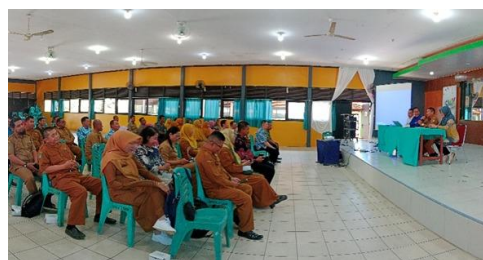
Gambar 1. Pemaparan Materi dari IDX

pasca-pandemi. Sesi ini berlangsung interaktif, ditandai dengan banyaknya pertanyaan peserta terkait cara memulai investasi dengan modal minim, perbedaan instrumen investasi, serta strategi mengenali skema penipuan. Seorang peserta menyampaikan bahwa ia baru memahami cara menyesuaikan produk investasi dengan profil risikonya setelah mengikuti sesi ini.