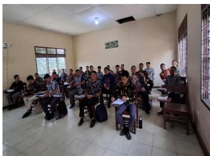
Gambar 2 Peserta mengikuti tes tertulis dan kuis

Pada tahap Evaluasi peserta dilakukan test tertulis dan kuis