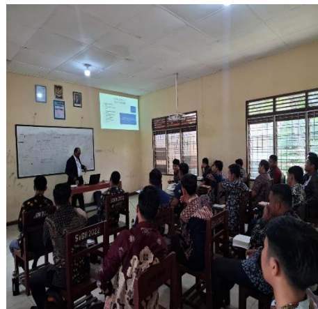
Gambar 1 : Narasumber Memberikan Materi Poda Tohonan Calon Guru Jemaat

Kegiatan Pengabdian Kepada Masyarakat (PKM) ini diawali dengan memberikan materi kepada calon guru jemaat di STGH HKBP Sipoholon yang telah disusun oleh narasumber.