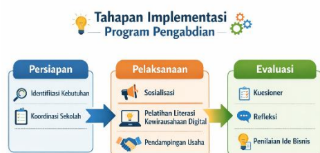
Gambar 1. Tahapan Implementasi Program Pengabdian

keterampilan dasar dalam mengembangkan usaha berbasis teknologi. Dengan demikian, program literasi kewirausahaan ini diharapkan dapat mendorong terbentuknya wirausaha muda yang kreatif, inovatif, dan adaptif terhadap perkembangan ekonomi digital, sekaligus memberikan kontribusi positif bagi pengembangan potensi ekonomi lokal di Kabupaten Sintang.