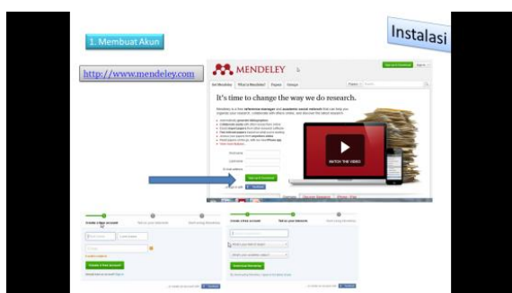
Gambar 2. Tangkapan layar (screen shoot) penjelasan instalasi aplikasi Mendeley

Pemaparan materi kemudian dilanjutkan dengan materi kedua yaitu tentang manajemen referensi aplikasi yaitu Mendeley. Pemateri menjelaskan langkah-langkah instalasi mendeley, cara memperbaiki metadata dari referensi, cara sitasi di Microsoft word dan membuat daftar pustaka secara otomatis.