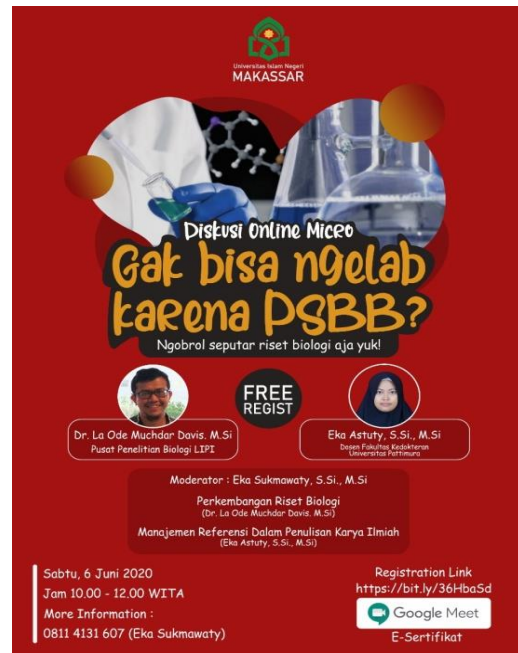
Gambar 1. Flyer Kegiatan Diskusi Online

Namun dalam kegiatan diskusi online ini, pemateri berfokus pada salah satu aplikasi manajemen referensi saja yaitu Mendeley karena metode pengoperasiannya lebih mudah sehingga cocok untuk digunakan untuk semua kalangan. Mendeley juga menyediakan penyimpanan online sebesar 2 GB untuk penggunaannya secara gratis.