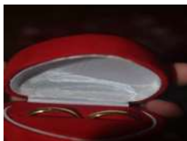
Gambar 1 Cincin Tunang

Masa pertunangan memiliki makna sebelum menjalin hubungan yang sah dimata adat maka pengantin harus melalui masa ini Sebelum pertunangan dimulai pihak mempelai laki-laki wajib menyerahkan seserahan tunangan sesuai ketentuan adat. Adapun seserahannya sebagai berikut; Menyerahkan cicin tunang minimal 1 (satu) gram emas.