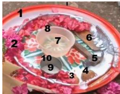
Gambar 2 Simbol (1) Talam, (2) Bunga, (3) Telur Ayam, (4) Tanah, (5) Besi, (6) Batu Peransah, (7) Air Bening, (8) Mangkok Penyimpan Air, (9) Beras Putih, (10) Canting

Nyengkolan merupakan pemberkatan atau proses ritual untuk menjauhi pengantin dari aura- aura negatif selama hidup berkeluarga. Seperti gambar di atas terdapat 10 (sepuluh) simbol seperti: