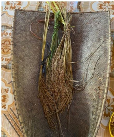
(Gambar 4.28) pungguk padi baru.

Pungguk padi baru ini digunakan dalam ritual nyemaru , maknanya sebagai pengkeras atau penguat padi baru agar padi yang ditanam selanjutnya di ladang dapat tumbuh berkembang baik, kuat serta kokoh dan dihindari dari hama dan binatang perusak padi lainnya. Memiliki simbol sebagai benih padi baru pertama yang dipanen dari ladang. Secara teori makna leksikal, makna simbol dari pungguk padi baru memiliki makna leksikal ‘serumpun padi yang pertama dipanen’.