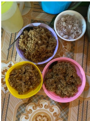
(Gambar 4.30) emping.

Memiliki simbol sebagai makanan khas pada saat ritual nyemaru . makna simbol berupa makanan ciri khas pada saat nyemaru dari beras pulut muda yang dihidangkan saat makan