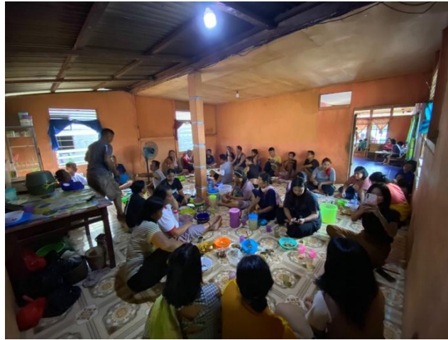
(Gambar 4.20) makan bersama keluarga sesudah ritual nyemaru

nyemaru . Dalam ritual nyemaru ini satu keluarga bersyukur karena dapat memakan nasi baru hasil dari ladang mereka sendiri dan ini dilakukan rutin setiap tahunnya.