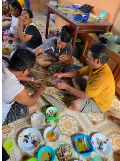
(Gambar 4.17) bepamang mengumpan pungguk padi baru yang ditujukan kepada para leluhur.

Setelah penarak siap bepamang sudah bisa dimulai satu keluarga berkumpul dari yang tua sampai ke anak cucu pada satu rumah. Pada saat bepamang pemimpin dalam ritual nyemaru meletakkan penarak ke pungguk padi baru (benih padi baru) yang telah disiapkan. Saat meletakkan penarak pemimpin dibantu oleh anggotanya untuk menuangkan tuak ke pungguk padi baru. Pada saat mengumpan pungguk padi baru ini ditujukan kepada para leluhur agar mereka yang diibaratkan hidup berdampingan dengan manusia agar mengetahui dan memberitahukan ada nya padi baru yang dihasilkan dari ladang atau sawah mereka dalam ritual nyemaru supaya tahun berikutnya bisa mendapatkan padi lagi yang melimpah ruah.