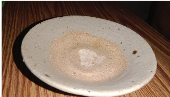
(Gambar 4.29) mangkuk adat.

Dalam ritual nyemaru , mangkuk adat dalam tradisi adat Dayak Ketungau Sesaek yang ada di Dusun Sejirak ini, yang digunakan berciri khas dengan bentuk nya yang bulat dengan ukuran mangkuk yang kecil serta warna nya abu-abu, memiliki simbol sebagai lambang adat istiadat dan merupakan perlengkapan adat yang digunakan saat ritual nyemaru ini yang harus terus dilestarikan. Secara teori makna leksikal, makna simbol dari mangkuk adat memiliki makna leksikal ‘wadah yang dimanfaatkan untuk menyimpan segala sesuatu’.