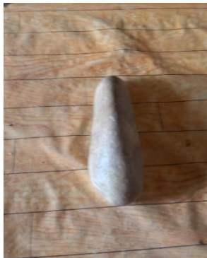
(Gambar 4.25) batu.

Dalam ritual nyemaru , batu yang berbentuk lonjong ini yang digunakan untuk menjemur padi baru dan akan diletakkan pada bagian sisi saat menjemur padi baru, karena hanya ada padi baru saja batu ini digunakan sebagai simbol adanya ritual nyemaru yang akan dilaksanakan. Makna batu sebagai simbol ini mempunyai satu makna yaitu, sebagai pengeras padi baru, yang artinya sebagai penguat padi baru. Secara makna leksikal batu memiliki makna leksikal yaitu ‘sejenis benda padat yang keras’.