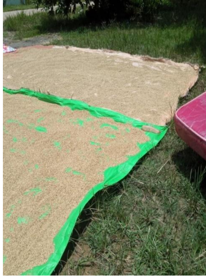
(Gambar 4. 12) penjemuran padi baru.

penjemuran padi tersebut harus diletakkan pada bagian sisinya yaitu, ada batu, tengkuyung berwarna hitam yang sudah kosong dan sebatang kunyit tunggal berwarna kuning..