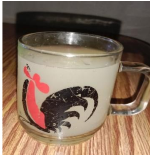
(Gambar 4.31) tuak.

Dalam ritual nyemaru merupakan minuman beralkohol yang terbuat dari beras ketan dan ragi kemudian di fermentasikan selama beberapa hari. Memiliki makna simbol yang distilahkan sebagai minuman yang dipersembahkan, bahan dari penarak (sesajen) untuk para leluhur. Secara teori makna leksikal, makna simbol dari tuak ‘sejenis minuman berakohol’.