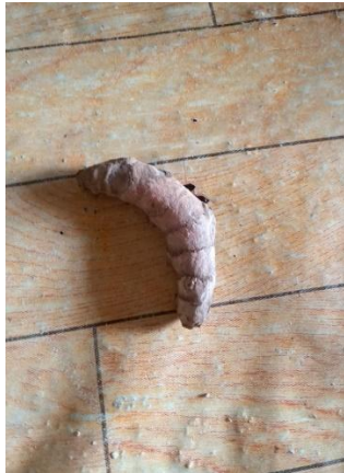
(Gambar 4. 26) kunyit.

Dalam ritual nyemaru , kunyit yang digunakan hanya 1 buah kunyit saja, memiliki simbol sebagai adanya padi baru pada saat menjemurnya, karena hanya ada padi baru saja kunyit sebagai simbol ini digunakan. Makna dari kunyit sebagai simbol ini mempunyai satu makna yaitu, sebagai pengeras padi baru, yang artinya sebagai penguat padi baru. Kunyit memiliki makna leksikal sebagai ‘tumbuhan herbal yang identik berwarna kuning’