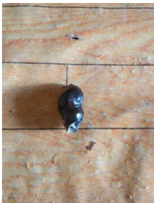
(Gambar 4. 24 ) tengkyung.

Dalam ritual nyemaru , tengkyung yang digunakan yaitu tengkyung yang berwarna hitam dan sudah tidak ada isinya hanya cangkangnya dan hanya satu saja yang digunakan.