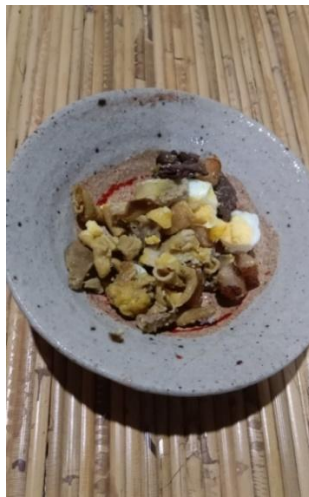
(Gambar 4.16) penarak (sesajen).

Tahap keempat ini merupakan puncak dari ritual nyemaru . Pada saat bepamang ada ketiga elemen yang akan diumpan oleh pemimpin yang dibantu oleh anggotanya yaitu mengumpan pungguk padi baru, mengumpan beras baru didalam ember yang sudah disiapkan dan terakhir mengumpan tungkuk (kompot) dengan mengucapkan mantra sambil meletakkan penarak tersebut. Bahan penarak yang sudah siapakan digabungkan menjadi satu dan dimasukkan kedalam mangkuk adat oleh pemimpin dalam ritual nyemaru .