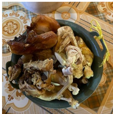
(Gambar 4.27) daging ayam.

Dalam ritual nyemaru ayam yang digunakan bisa ayam kampung bisa juga ayam ternak yang dibeli dipasaran. Bagian perut, darah, dan kepala ayam pada bagian ini menggunakan satu ekor ayam yang sudah di potong, dan digunakan sebagai syarat isi dari penarak (sesajen).