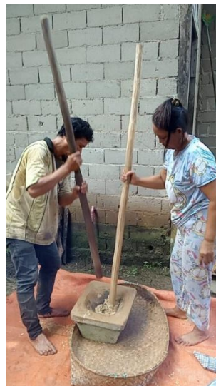
(Gambar 4. 14) menumbuk padi pulut.

Setelah itu tahap keduanya, padi pulut tersebut dioseng menggunakan kuali dan mengaduknya menggunakan sendok kayu, tahap pengosengan padi ini dimasak menggunakan kayu api tidak menggunakan kompor gas.