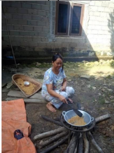
(Gambar 4. 13) pengosengan padi pulut.

Setelah itu tahap keduanya, padi pulut tersebut dioseng menggunakan kuali dan mengaduknya menggunakan sendok kayu, tahap pengosengan padi ini dimasak menggunakan kayu api tidak menggunakan kompor gas.