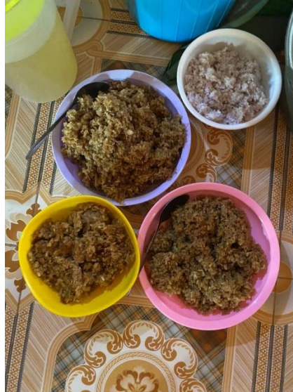
(Gambar 4.15) emping yang sudah jadi.

penumbukan agar tekstur dari padi tersebut lemah kemudian akan menjadi bentuk yang pipih dan tipis.