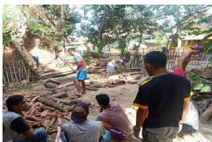
Gambar 4.5 Gotong royong mencari kayu bakar

Gotong royong merupakan bentuk solidaritas sosial yang terbentuk karena adanya bantuan dari pihak lain untuk kepentingan pribadi maupun umum. Gotong royong dapat