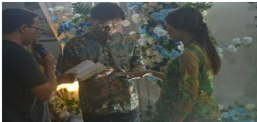
Gambar 4.1 Antar ramu atau tunangan

Sebelum sampai pada prosesi pernikahan, kedua belah pihak yang merencanakan perkawinan melaksanakan adat ramu (adat tunangan). Beberapa materi adat yang dikeluarkan pihak laki-laki pada adat ramu adalah seperangkat pakaian untuk perempuan, cincin sebetuk, piring putih sebuah, mangkuk putih sebuah, tuak dua tempayan, ayam dua ekor, dan beras 10 kg. Sementara itu, materi adat yang dikeluarkan pihak perempuan adalah tuak satu tempayan, cincin sebetuk, dan beberapa perlengkapan lainnya.