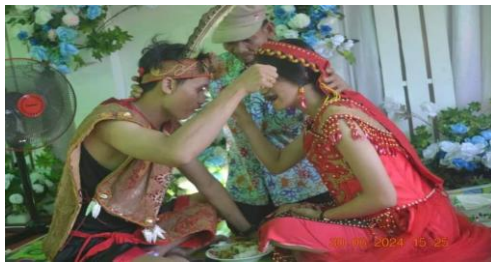
Gambar 4.3 Makan nasi adap

Acara makan nasi adap adalah acara makan nasi dimana pengantin secara bersama-sama makan dalam satu piring. Makan nasi adap ini adalah makan dengan nasi putih dalam satu piring dengan ayam dan babi yang sudah di rebus dengan air biasa tidak diberi garam dan penyedap lainnya dan kemudian di potong oleh tetua yang biasanya menyiapkan segala perlengkapan adat yang telah di minta oleh ketua adat. Selain kedua mempelai, pesuruhnya juga ikut makan disaksikan oleh para tokoh masyarakat dan pengurus adat. Pada saat itu juga para pengurus adat dan tetua kampung mamberikan petuah-petuah dan nasehat kepada kedua mempelai mengenai langkah-langkah dan jalan hidup mereka nantinya. Prosesi ini juga disaksikan oleh semua yang hadir disitu. Lalu kedua mempelai belilup atau biasanya disebut dengan minum tuak secara bersamaan, diikuti kedua orang tua dari kedua mempelai dan orang lain.