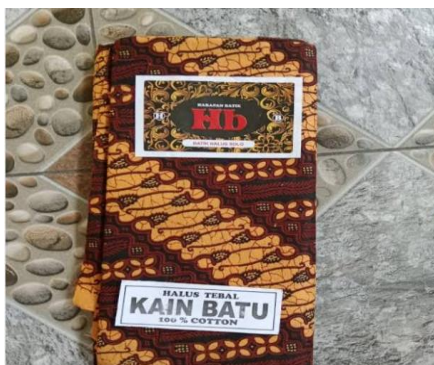
Gambar 4.8 Kain panjang