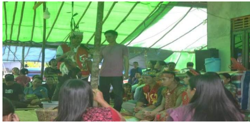
Gambar 4.4 napak tajau atau berdiri tajau

Napak tajau adalah salah satu rangkaian proses pernikahan secara adat dimana kedua mempelai bertapa di tiang tajau . Lalu orang yang ditunjuk oleh orang tua kedua mempelai menyembah di tiang tajau itu. Setelah bertapa, kedua mempelai menyandung (menuangkan sekaligus memberikan) tuak kepada para tamu. Tak lama kemudian ketua adat mengumumkan bahwa adat perkawinan mereka sudah selesai. Dalam Adat kawin dibagi menjadi dua, yaitu Perkawinan Gereja dan Pesta Adat Gawai Kerunggun.