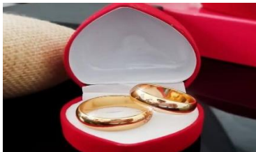
Gambar 4.6 cincin sebentuk

Cincin yang dimaksud adalah cincin yang berbentuk lingkaran dan serupa. Cincin yang digunakan harus serupa memiliki bentuk yang polos atau tidak memiliki permata lainnya, karena cincin ini melambangkan kesucian dan kemurnian. Cincin dalam adat Dayak Ketungau Sesaek memiliki makna bahwa mereka telah sah menjadi pasangan dan cinta kedua mempelai atau pasangan tidak akan terpisahkan sampai maut memisahkan. Jika cincin ini telah dikenakan kedua pasangan, maka tidak diperbolehkan untuk memilih orang lain lagi. Warna cincin yang dipakai harus berwarna emas, emas ini memiliki makna bahwa cinta kedua pasangan ini akan terus bersinar dan tidak akan pudar. Seserahan ini adalah wujud doa dan pengharapan sebagai