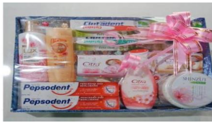
Gambar 4.9 perlengkapan wanita

Seserahan ini memiliki makna agar isteri tetap selalu menjaga kebersihan dan penampilan diri untuk suami dan suami akan selalu menjamin kebahagiaan isterinya dengan memberikan kebutuhan akan kebersihan isterinya dan suami siap menafkahi segala kebutuhan isterinya. Aturan adat mewajibkan harus ada perlengkapan mandi seperti sabun mandi, odol, sikat gigi, sampo, tempat sabun berserta alat rias diri seperti bedak, parfum, handbody, dan sebagainya. Perlengkapan ini harus ada walaupun tidak semuanya diberikan, tetapi untuk perlengkapan mandi dan rias harus wajib ada. Dari seserahan ini memiliki makna bahwa perempuan dapat menjaga penampilan dan senantiasa tampil baik dan sopan di depan suami.