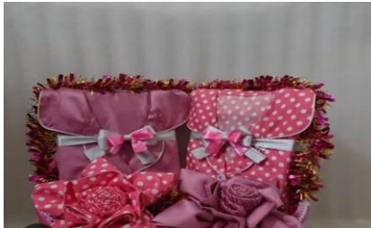
Gambar 4.7 sepasang baju tidur

Barang atau pakaian perempuan yang di serahkan pihak laki-laki tidak ditentukan seperti apa, tetapi biasanya adalah sepasang baju tidur. Pada saat penyerahan pakaian ini yang mengeluarkan pakaian dari pihak laki-laki sendiri yang bertanggungjawab atas isterinya. Baju yang diberikan tersebut melambangkan bahwa pihak laki-laki siap untuk melindungi perempuan dari hal yang tidak diinginkan dan supaya tertutup oleh pakaian yang diberikan oleh pihak laki-laki dan juga supaya rumah tangga pasangan dapat disimpan dengan baik. Pakaian untuk isteri memiliki makna bahwa calon pengantin laki-laki mampu untuk menjaga dan menafkahi lahir dan batin isterinya dengan baik setelah menikah.