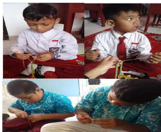
Gambar 2. Kegiatan siswa