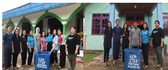
Gambar 4. Pembuatan Tempat Sampah untuk Gereja Dan Masjid

Kegiatan pembuatan tempat sampah berlangsung selama 3 hari pelaksanaan Dengan adanya kegiatan Pembuatan Tempat sampah yang akan di simpan di tempat-tempat umum dengan adanya tempat sampah ini diharapkan masyarakat di Desa Tiong Keranjik dapat membuang sampah pada tempatnya serta dapat menumbuhkan kesadaran bagi masyarakat dalam membuang sampah.