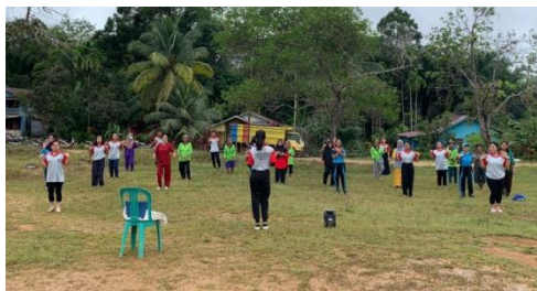
Gambar 3. Senam Bersama Masyarakat

Bersama ini diharapkan masyarakat didesa ini lebih giat dalam melakukan Senam, baik bersama maupun individu, supaya selain menjaga kebugaran tubuh bisa juga menjaga ketahanan tubuh dari penyakit dan bisa memperat hubungan kekeluargaan Didesa Tiong Keranjik.