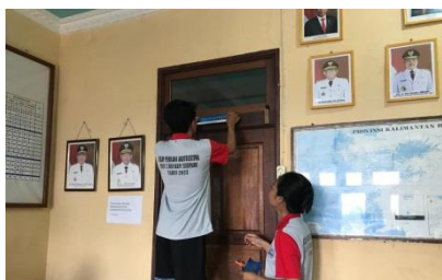
Gambar 4. Pemasangan Plang Kantor Desa

Pembuatan dan pemasangan plang ruangan kantor desa ini bertujuan agar masyarakat dan orang pendatang baru saat mencari ruangan kantor desa dapat dengan mudah mengetahui ruangan yang di tuju melalui Plang ruangan kantor desa tersebut. Masalah yang dipecahkan adalah agar tidak ada lagi masyarakat yang datang dari jauh, maupun orang lain ketika mencari ruangan di kantor desa tidak salah dan kesulitan