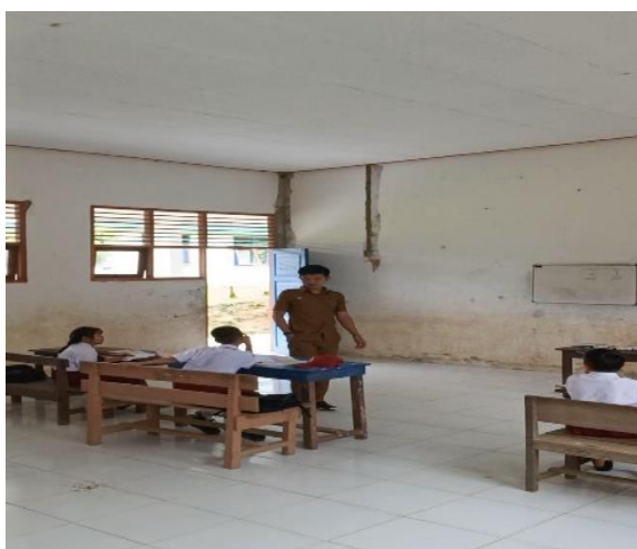
Gambar 1. Pemberian pelajaran tambahan di SDN 002 Bahau Hulu.