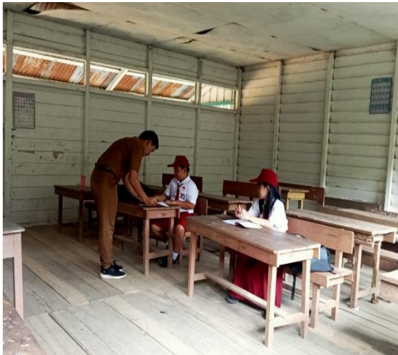
Gambar 3. Pemberian pelajaran tambahan di SDN 004 Pujungan.