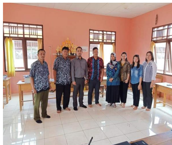
Gambar 2. Pemberian pelajaran tambahan di SDN 002 Kayan Hulu.