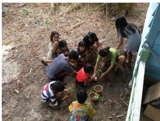
Tabel 3. Hasil Post Test Literasi Memaba dan Menulis

Selama proses praktek modul pembelajaran materi limbah ini siswa tentu saja diawasi dan dibimbing oleh pemateri. Setelah penerapan materi limbah, untuk mengetahui apakah materi yang saya berikan tersampaikan dengan baik atau tidak maka post test dilangsungkan.