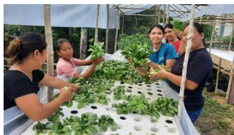
Gambar 1. Kebun gizi Desa Tanjung Hulu

kurang sehat (Wahyuni, 2020). Selain itu, bisa juga disebabkan oleh anak mengalami Gerakan Tutup Mulut (GTM).