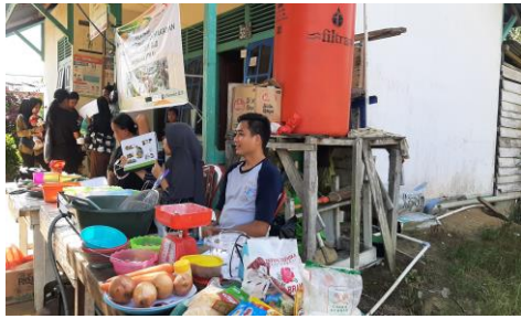
Gambar 2. Penyampaian materi MP ASI

Menu 4 bintang, pangan lokal dan bahan pangan hasil kebun gizi.