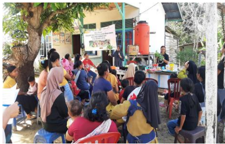
Gambar 3. Demonstrasi pengolahan makanan

Menu 4 bintang, pangan lokal dan bahan pangan hasil kebun gizi.