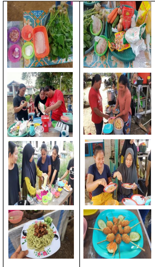
Gambar 4. pembuatan mie sayur & nugget.

Pada gambar 4 dapat dilihat keaktifan peserta pelatihan pada kegiatan simulasi pembuatan produk tersebut. Mereka juga menyampaikan bahwa mereka berinisiatif untuk mempraktikkan pembuatan makanan ini setelah selesai kegiatan pelatihan.